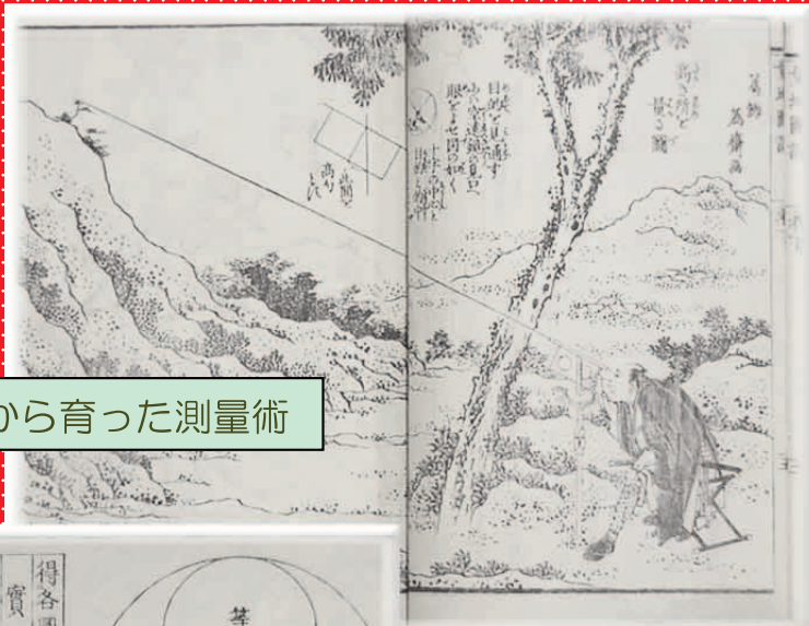
和算から育った測量術