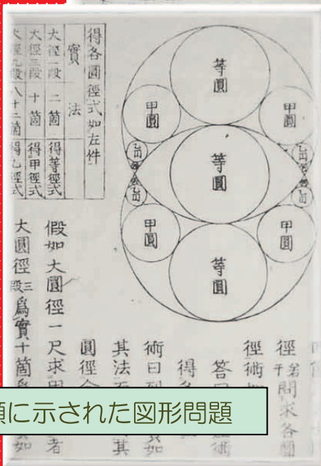
算額に示された図形問題