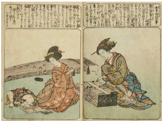
『双六独稽古』（すごろくひとりげいこ）

展示場所：東北大学附属図書館本館 エントランスホール展示コーナー（入場無料） 仙台市青葉区川内 27-1